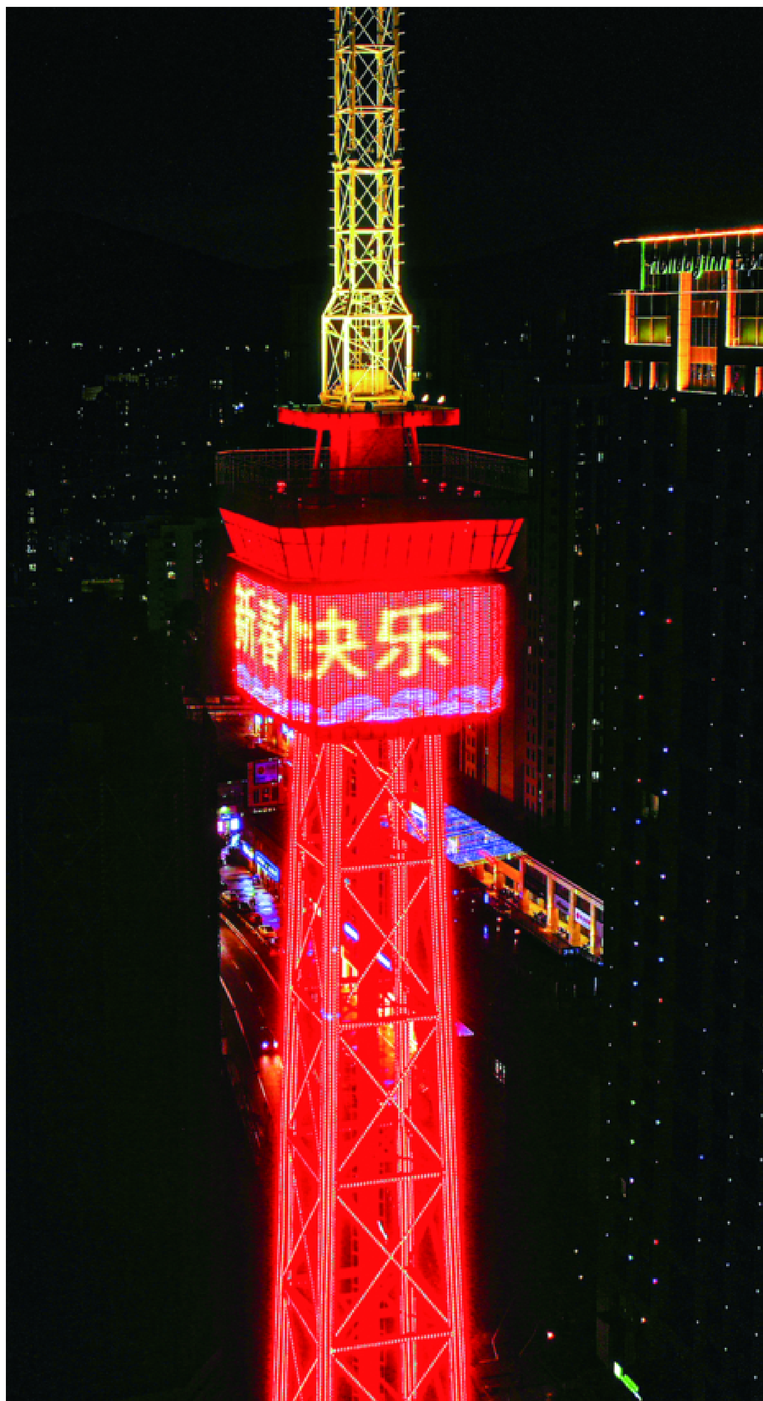
定海东岳山电视塔亮起“中国红”迎新春