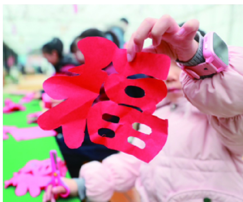
学生体验剪“福”字等年俗活动