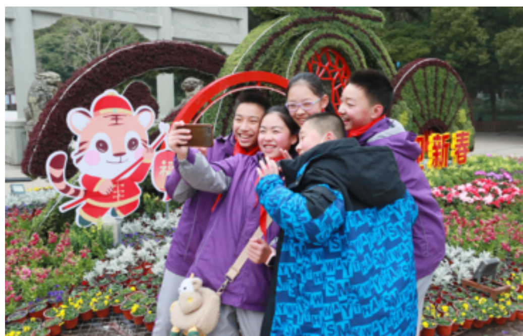
海山公园“瑞虎迎春”主题绿雕吸引市民拍照留念