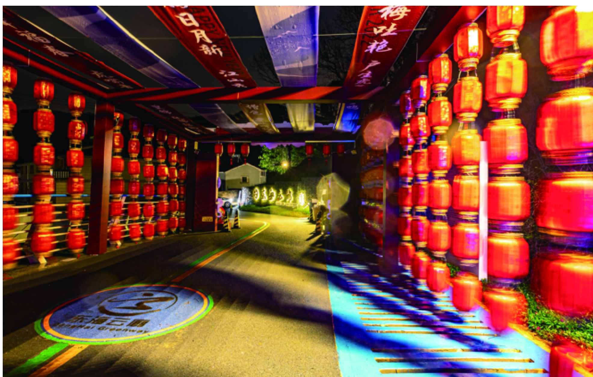
「东海云廊」布置一新迎新春