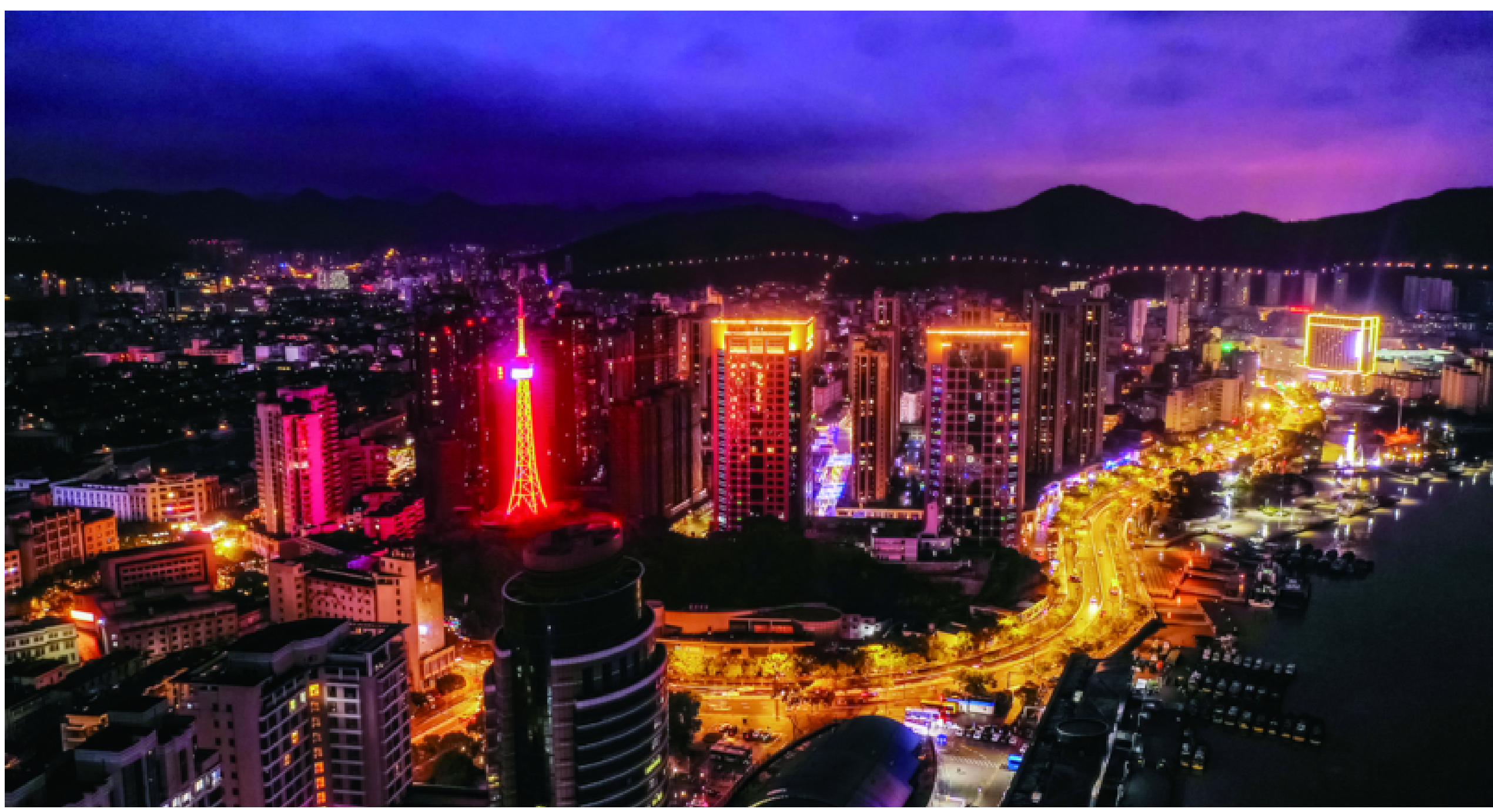
绚丽的定海湾夜景