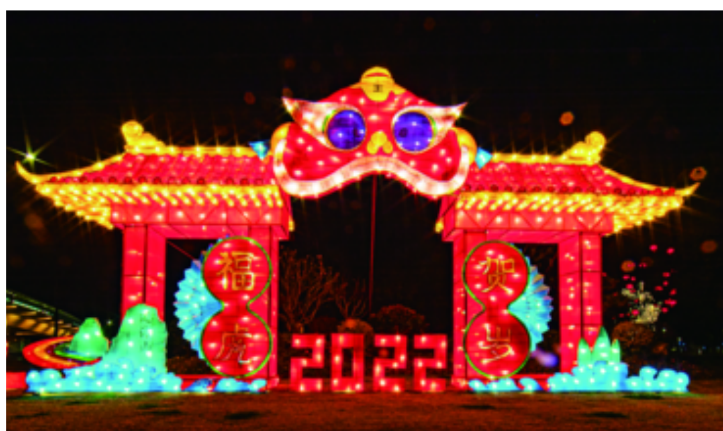
定海湿地公园的“福虎贺岁”景观彩灯亮灯