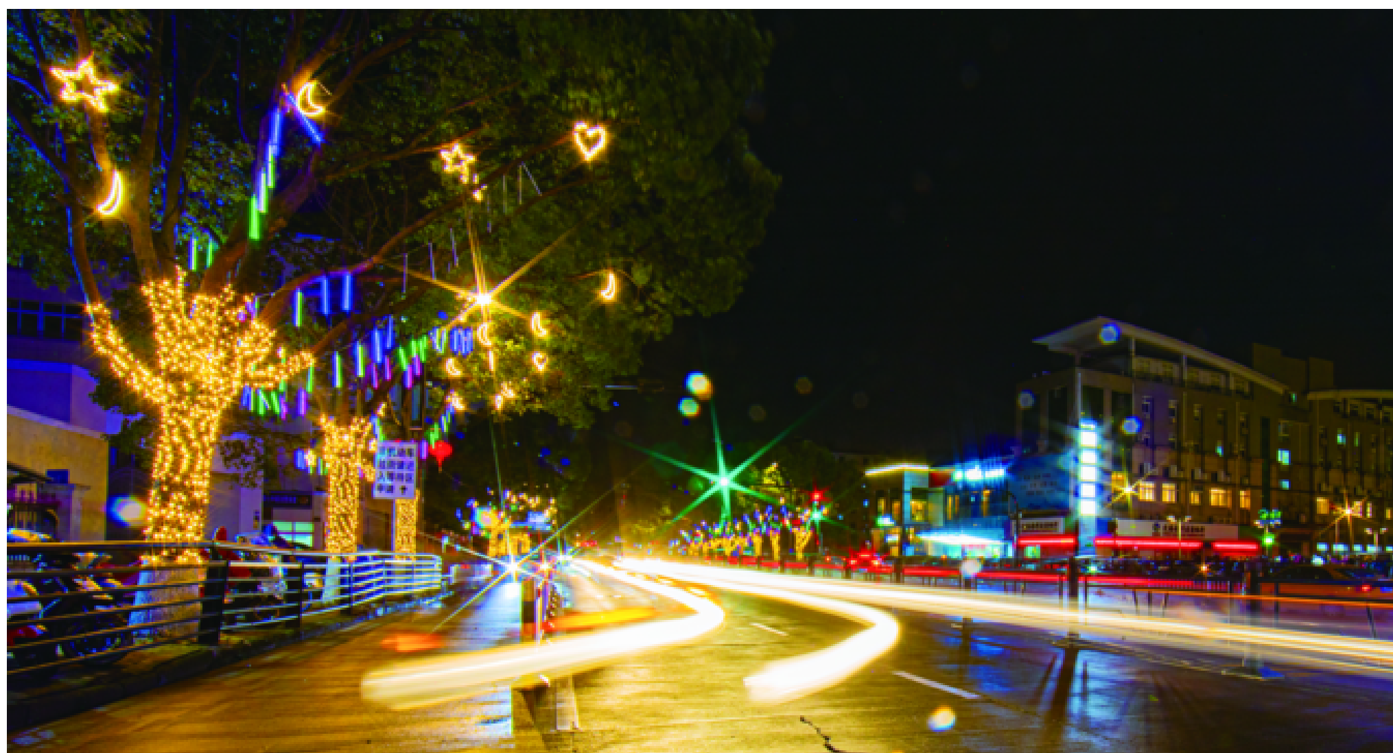
城区东瀛路的“星月”满树景观灯夺目

写春联、贴福字、挂灯笼……中国传统节日春节的序曲正式奏响。连日来，我区大街小巷处处洋溢着新年的气氛，城区主要道路两侧挂起了灯笼和彩灯，放眼望去，色彩变化如梦如幻，这一夜景也成为了一大亮点，营造出一片欢快、喜庆、祥和的节日氛围。