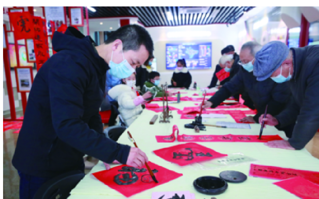
书法爱好者用浓浓墨香迎接新春到来